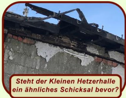
Steht der Kleinen Hetzerhalle ein ähnliches Schicksal bevor?