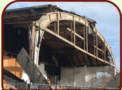
Traurig stimmende Bilder der Grossen Hetzerhalle am 18.02.2021